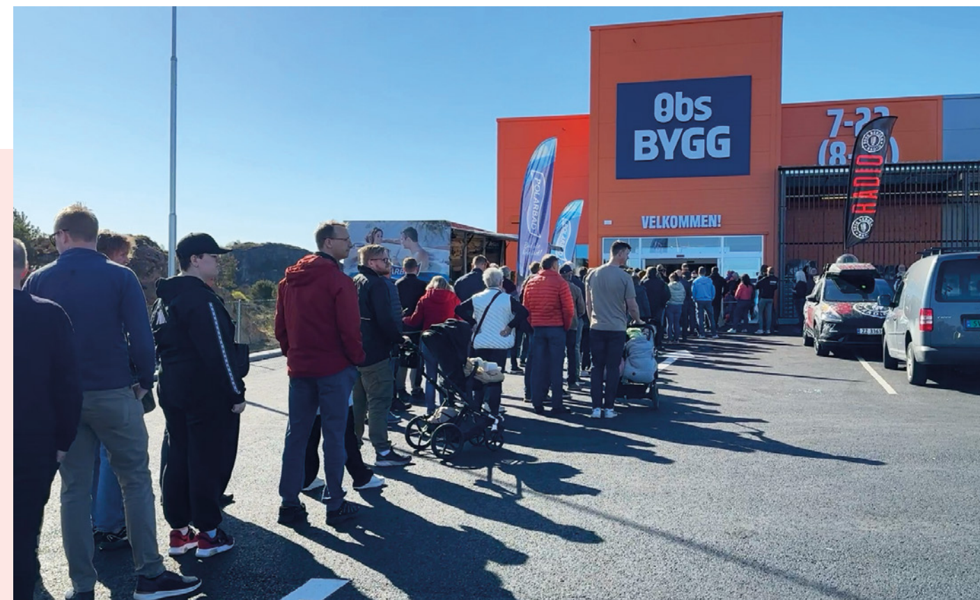
Obs BYGG Straume