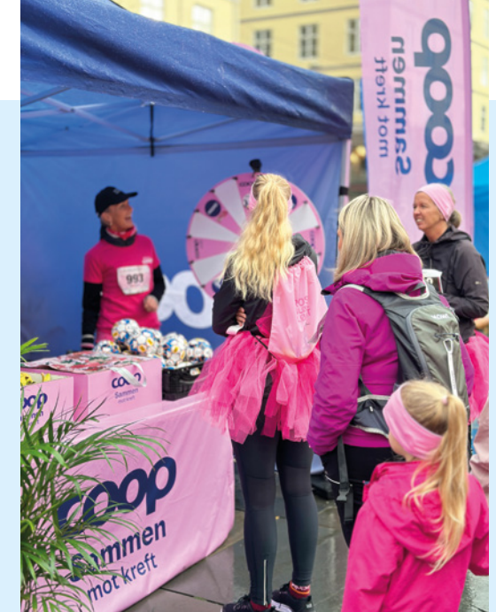
Coop Hordaland sin stand under Rosa Sløyfe-løpet i Bergen Sentrum 3. oktober. Her deles ut bananar, Lypstyl, Coop muslibar og diverse gåver frå eit populært lykkehjul.

Eit sterkt engasjement med heile 88 tilsette frå Coop Hordaland deltok i Rosa Sløyfe-løpet i Bergen sentrum den 3. oktober 2023. Dette er ein auke frå året før, og vi kom på ein sterk 3. plass når det gjeld tal på deltakarar blant alle samyrkjelag i Noreg. Coop i Noreg vart den verksemda med flest deltakarar i dei fysiske løpa som fann stad i Noreg, og det vart sett ny rekord med heile 676 deltakarar totalt i Rosa Sløyfe-løpet.