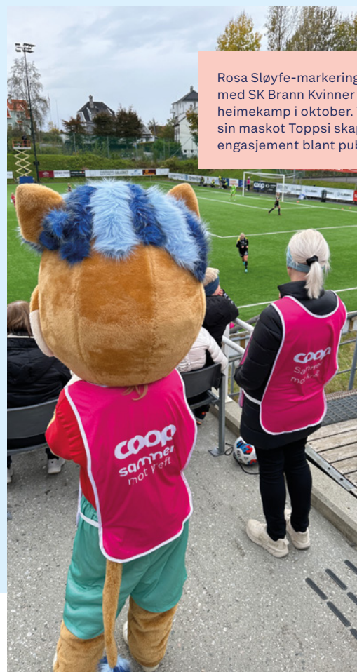
Rosa Sløyfe-markering i samarbeid med SK Brann Kvinner under ein heimekamp i oktober. Toppserien sin maskot Toppsi skaper flott engasjement blant publikum.

Vi jobbar kontinuerleg med å redusere vår miljøpåverknad. Dette inkluderer tiltak som kjeldesortering, energieffektivisering og reduksjon av plastforbruk. Vi ønsker å vere ein ansvarleg aktør i lokalsamfunnet og ta vare på miljøet for komande generasjonar.